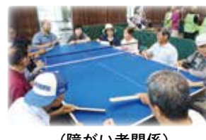
(障がい者関係) 健康づくり・集い