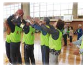
(高齢者関係) 健康づくり事業