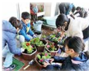
(児童・青少年) 花いっぱい運動ほか