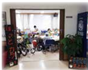
(障がい者関係) ふれあい広場『ほっとカフェ』