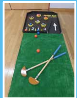
追加整備しました。《ポケットボール》